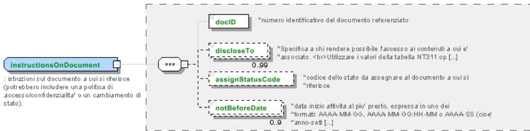
Immagine rappresentative della struttura dei principali elementi complessi.